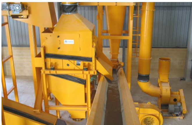
Mesas de separación densimétrica.