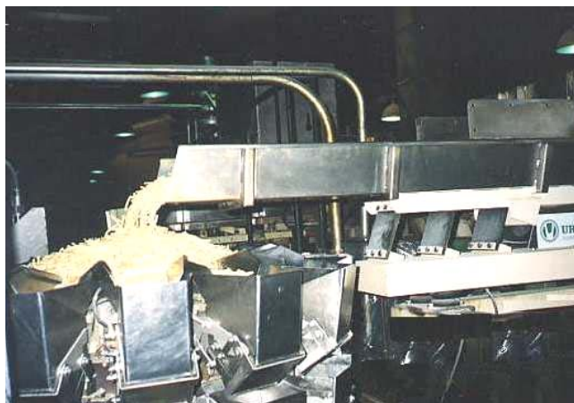
Transportadores vibrantes de caudal regulable.