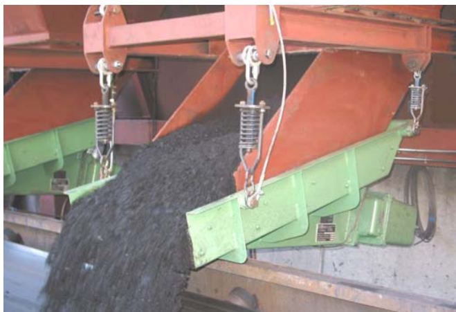
Alimentadores vibrantes para grandes caudales.