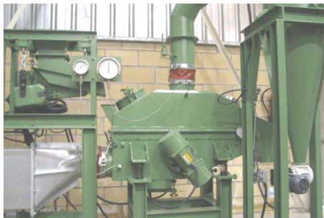
Secadores-Enfriadores de lecho fluido.