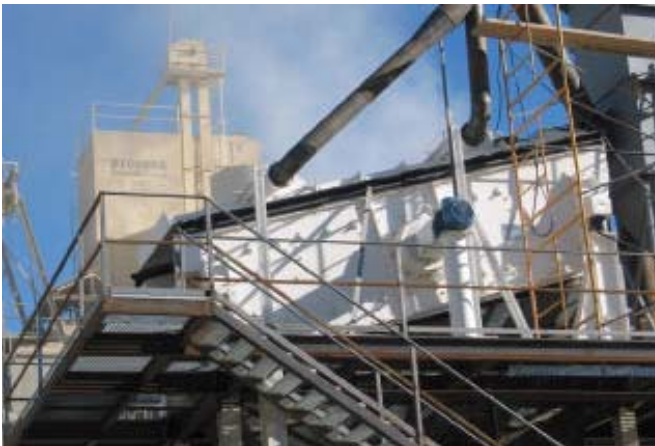
Cribas de accionamiento mecánico