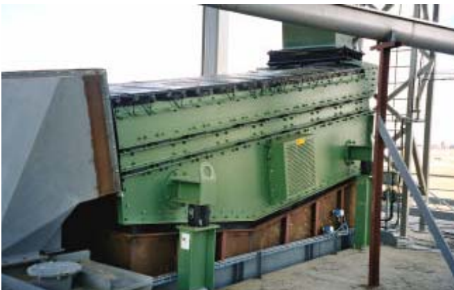
Cribas anticolmatantes de malla elástica